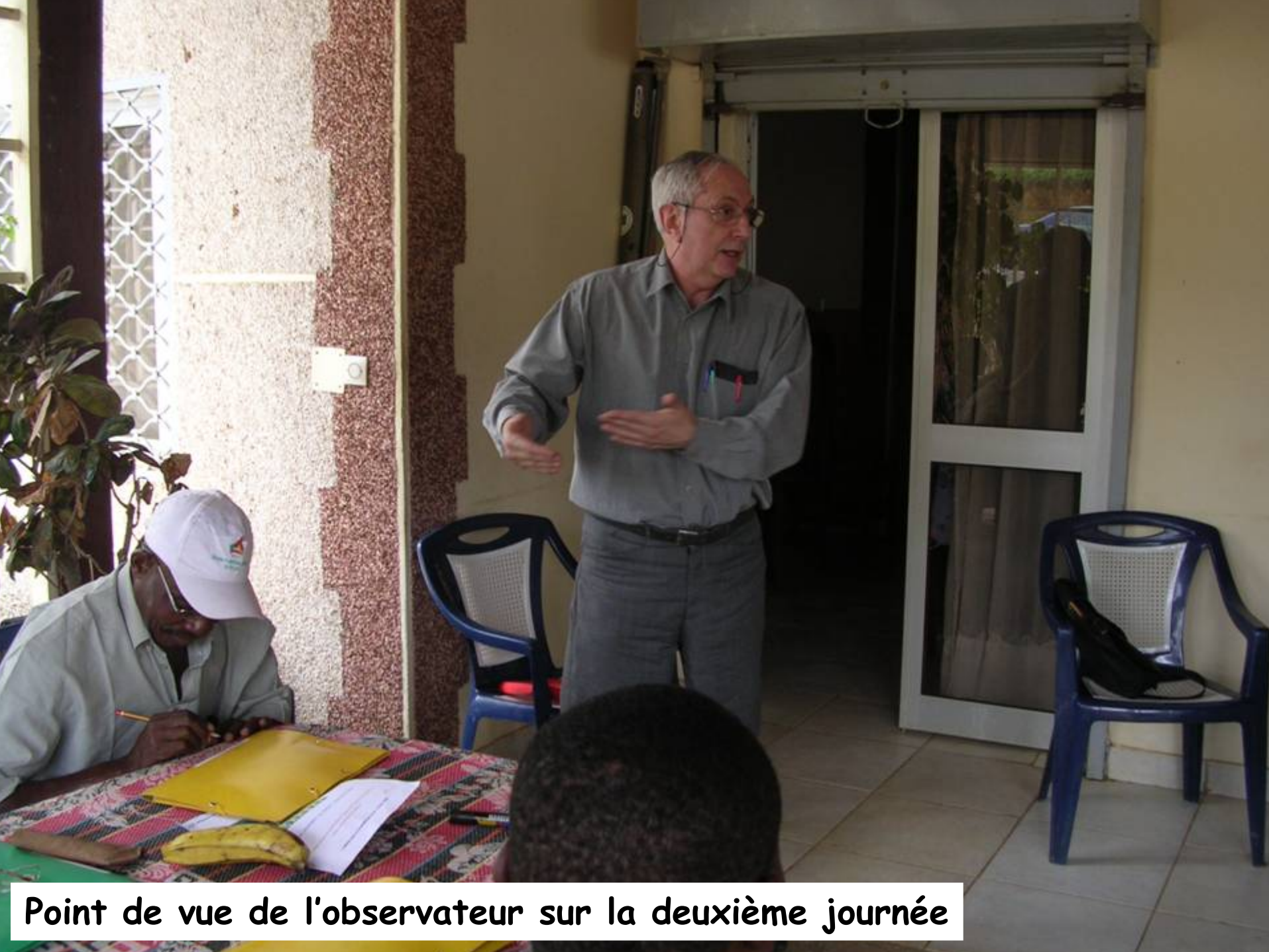
Point de vue de l'observateur sur la deuxième journée