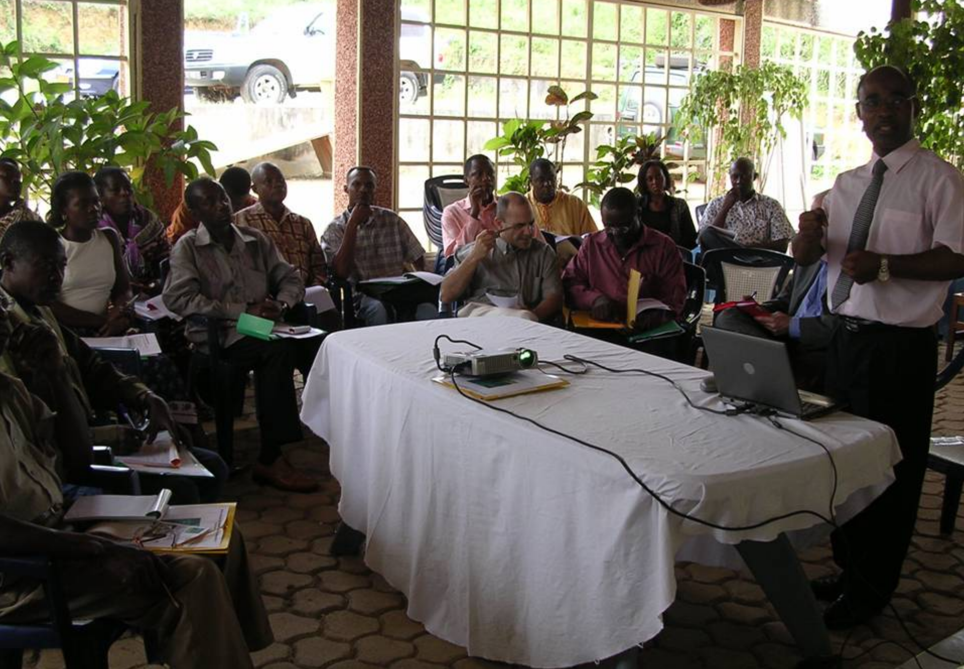
Présentation du projet INNOBAP