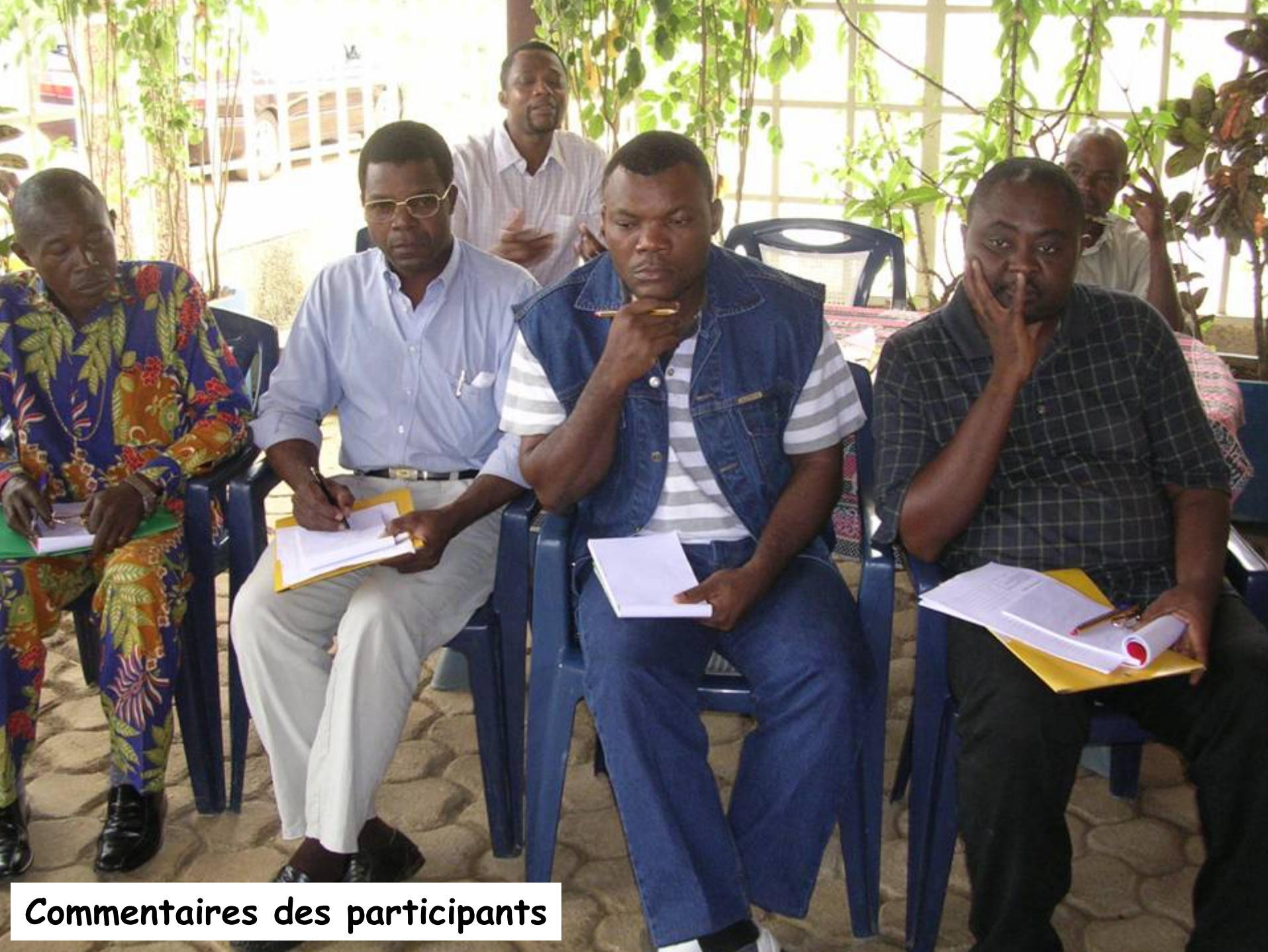
Commentaires des participants