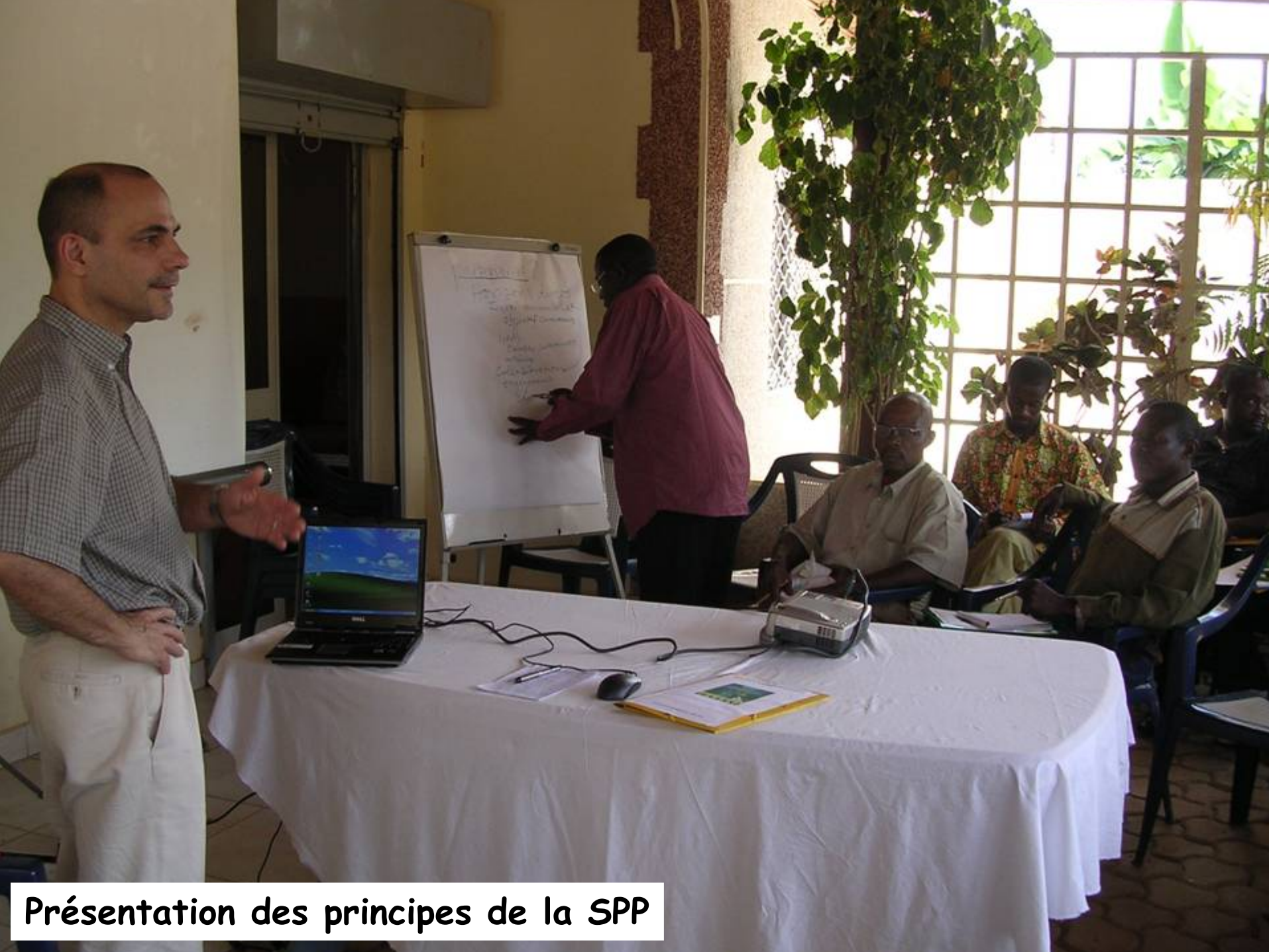
Présentation des principes de la SPP