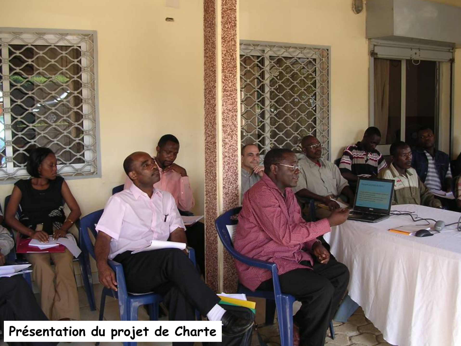
Présentation du projet de Charte