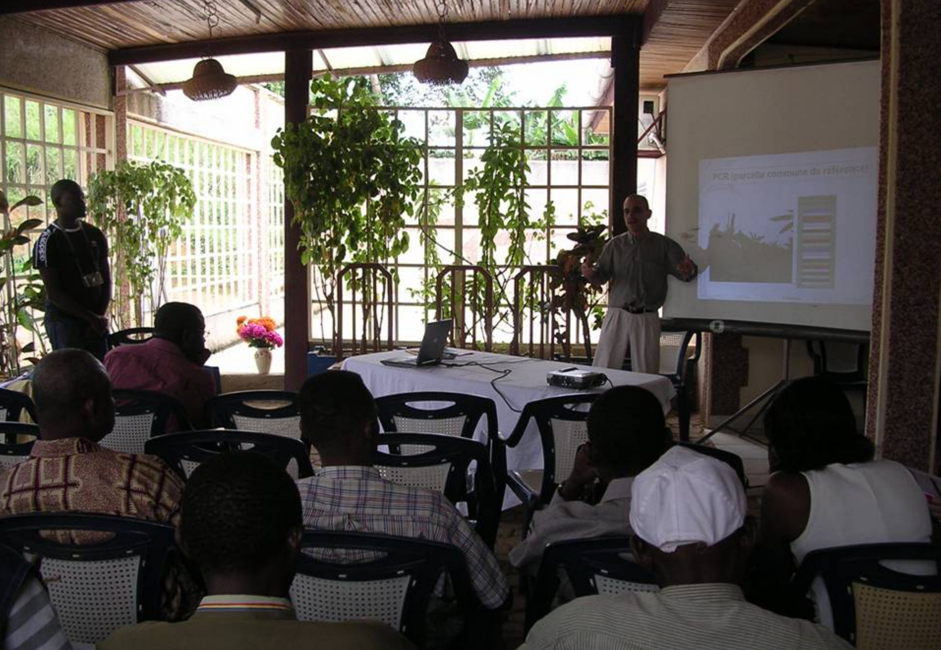
Présentation du projet INNOBAP