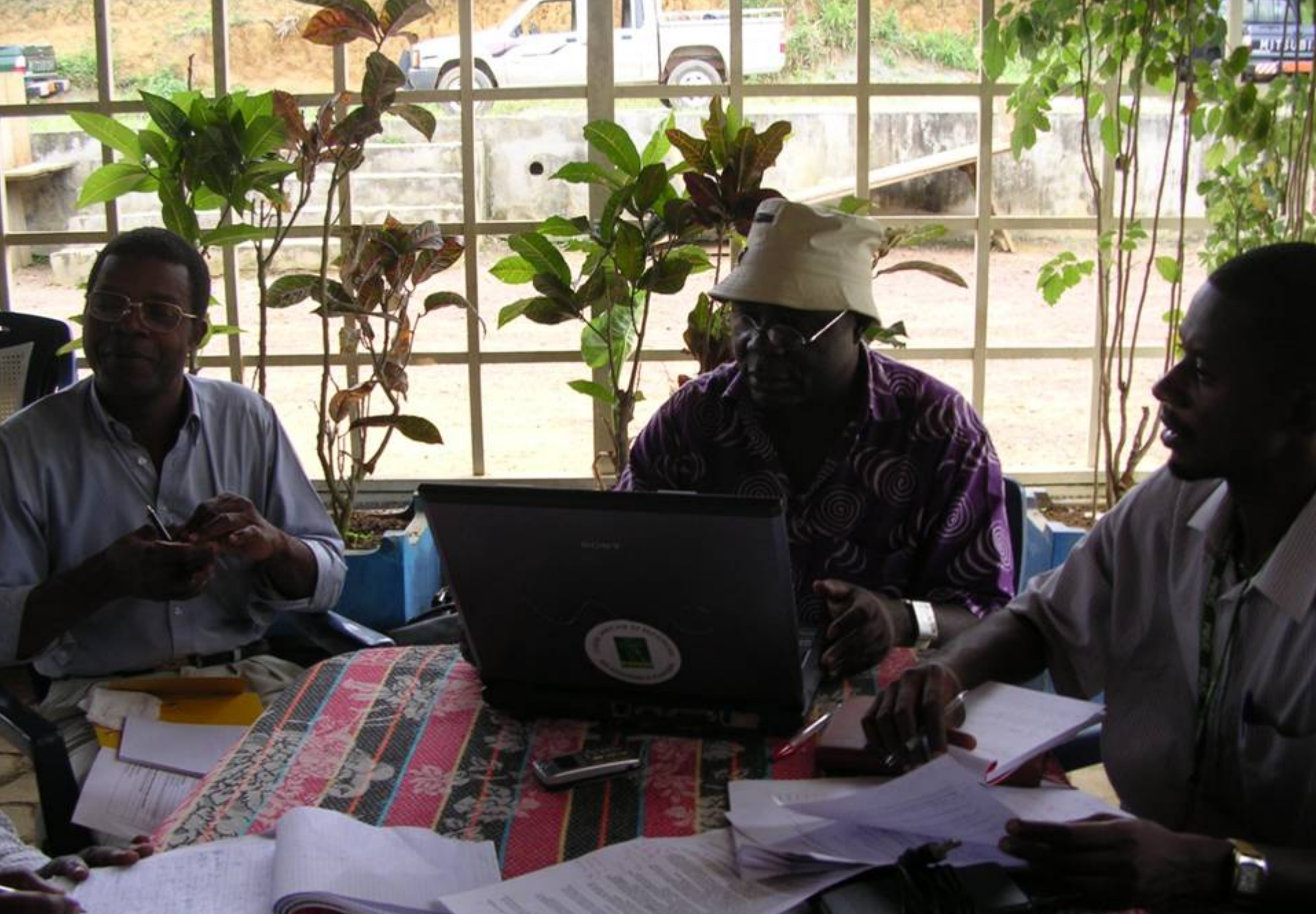
Travaux de groupes sur le programme d'activités et le budget