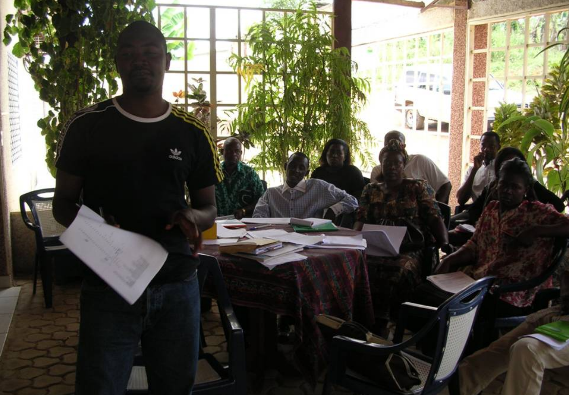
Résultats des travaux de groupes