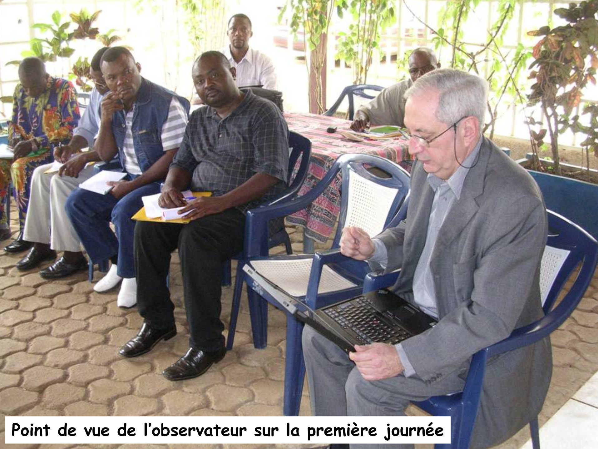
Point de vue de l'observateur sur la première journée